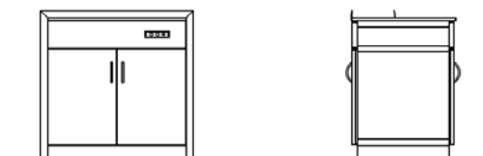
TUNNEL PASSASPORCO - ALTEZZA 1000 mm